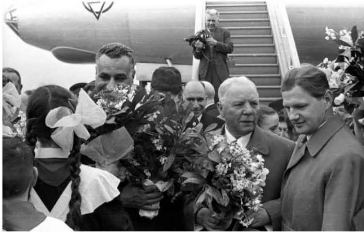
زيارة عبد الناصر للاتحاد السوفيتي ١٩٥٨/٤/٣٠